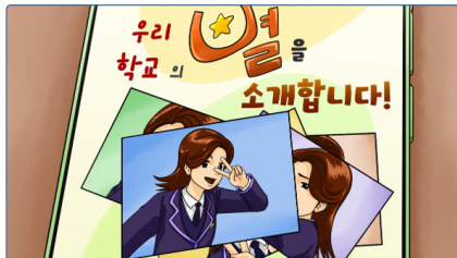
학교폭력 예방교육 동영상(중등용)