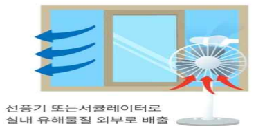
[창문이 1개인 경우 환기방법]