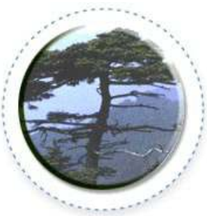
교목 - 소나무