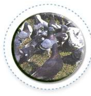
교조 - 비둘기