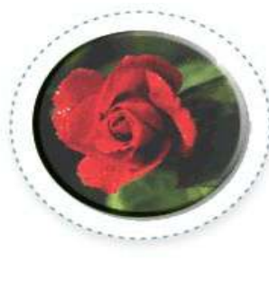
교화 - 장미