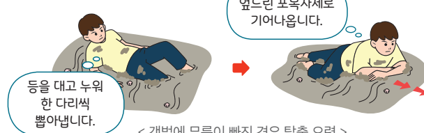
< 갯벌에 무릎이 빠진 경우 탈출 요령 >