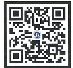
프로그램 다운로드 바로가기 QR코드