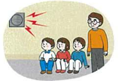
교내 방송 또는 라디오 방송 잘 듣기