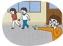
선생님과 지정된 대피장소로 이동