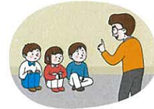
대피장소에 머물며 침착하게 행동하기