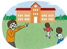
운동장 등 실외활동 시 실내 또는 지정된 대피 장소로 신속히 이동