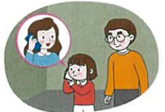
선생님 안내에 따라 부모님께 연락하기