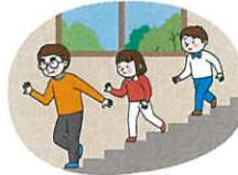
계단을 이용하고 밀거나 뛰지 않기