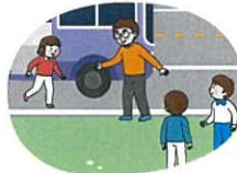
현장학습 등 차를 타고 이동 중에는 가까운 공터, 도로 오른쪽 정차 후 안전한 곳으로 대피