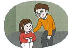
마음이 불안한 학생은 선생님에게 말하기