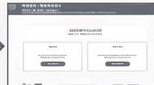
학생참여하기 버튼 클릭

※ 검사 대상 : 중학교 1학년 고등학교 1학년(학생이 직접 참여합니다.)