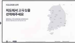
해당 시·도 선택