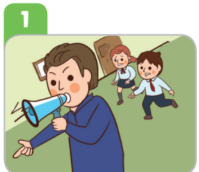
1 선생님과 함께 정해진 대피 장소로 이동해요.