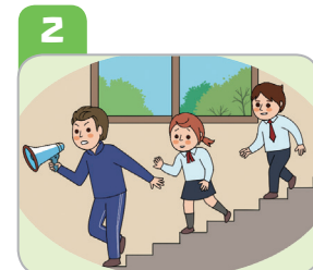
2 계단을 이용하고, 밀거나 뛰지 않아요.(엘리베이터 이용 금지)