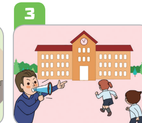
3 운동장 등 실외활동 시 실내 또는 지정된 대피 장소로 이동해요.