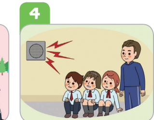
4 대피 장소에 머물며 침착하게 행동하고, 재난 방송을 들어요.