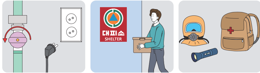
가스 차단, 전기코드 분리 비상용품 대피소로 이동 개인보호장비 정비