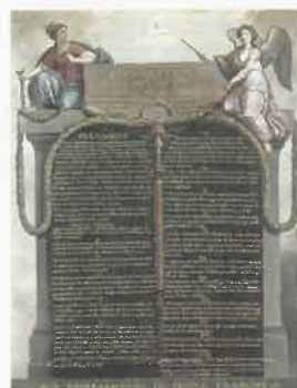
프랑스 인권 선언문

혁명 재판소는 1792년에 반혁명주의자를 단속하기 위해 만들어진 것으로, 공안 위원회와 함께 공포 정치의 대표적인 기구로 활용되었다. 처음에는 자코뱅파가 귀족 왕당파, 지롱드파의 남은 세력을 숙청할 목적으로 활용하였으나, 점차 당쟁에 이용되었다. 공안 위원회는 1793년 로베스피에르가 혁명 전쟁과 국내 반혁명 세력의 반란에 대처하기 위해 제안한 거국일치 위원회에서 비롯되었다. 로베스피에르는 이를 통해 자코뱅 독재 체제를 구축하고 공포 정치를 행하였다.