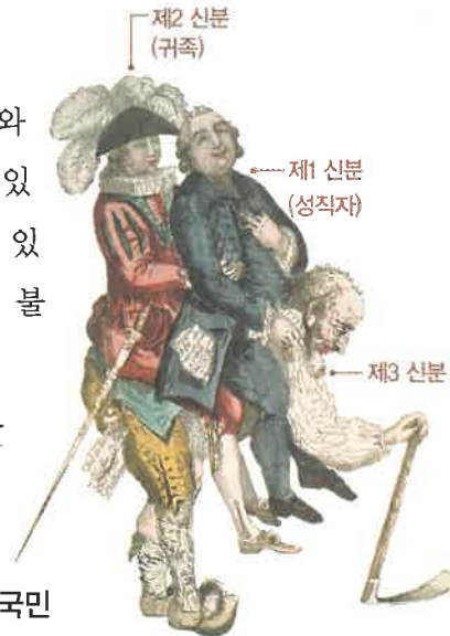
구제도의 모순을 풍자한 그림

프랑스의 삼부회는 1302년 필리프 4세가 성직자·귀족·도시의 대표를 모아 노트르담 성당에서 개최한 것에서 기원하였다. 삼부회는 신분제 의회로, 제1 신분 성직자, 제2 신분 귀족, 제3 신분 평민의 대표들로 정형화되었다. 프랑스의 삼부회는 왕의 주도 아래 자문에 응하는 기관으로, 왕권을 제약하던 영국 의회와 성격이 달랐다. 프랑스에서는 의회의 소집권과 의안 발의권이 모두 국왕에게 있었으며, 의원들의 의결권도 인정되지 않았다. 14세기에 파리의 상인 대표를 중심으로 삼부회를 근대적인 형태의 의회로 바꾸려는 시도가 있었으나 이루어지지 않았다. 그마저도 1614년 이후 170여 년간 한 번도 소집되지 않았다. 그러다 1789년에 루이 16세가 재정 문제로 위기를 겪으면서 삼부회를 소집하였다. 그러나 토의 형식과 투표 표결 방식의 문제로 심각한 갈등이 일어나 결국 프랑스 혁명이 발발하였다.