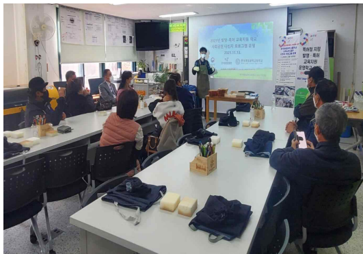
① 발명특허(지식재산) 개요 살펴보기