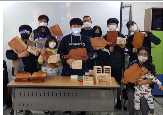
④ 작품 발표