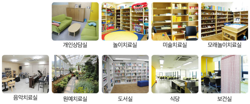
개인상담실, 놀이치료실, 미술치료실, 모래놀이치료실, 음악치료실, 원예치료실, 도서실, 식당, 보건실