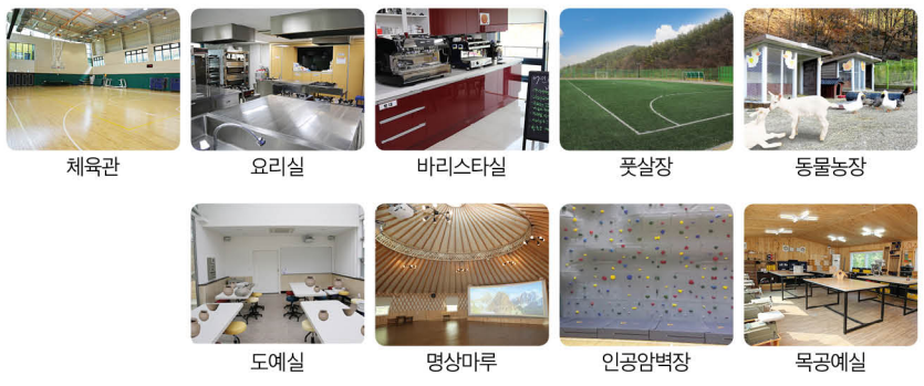
체육관, 요리실, 바리스타실, 풋살장, 동물농장, 도예실, 명상마루, 인공암벽장, 목공예실