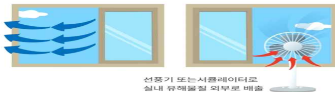
선풍기 또는 서큘레이터로 실내 유해물질 외부로 배출