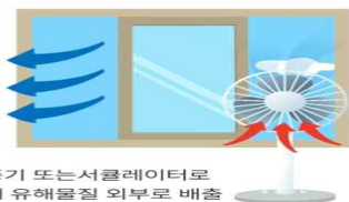
선풍기 또는 서큘레이터로 실내 유해물질 외부로 배출