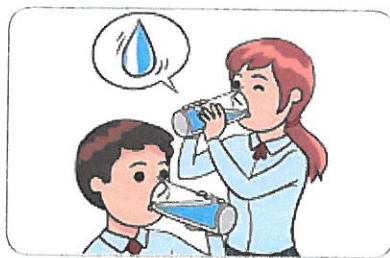
1 물을 자주 적당히 마신다.