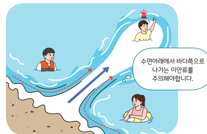
< 이안류(거꾸로 치는 파도) >

** 수면아래에서 바다 쪽으로 나가는 강한 역류성 흐름(최고 3m/sec).