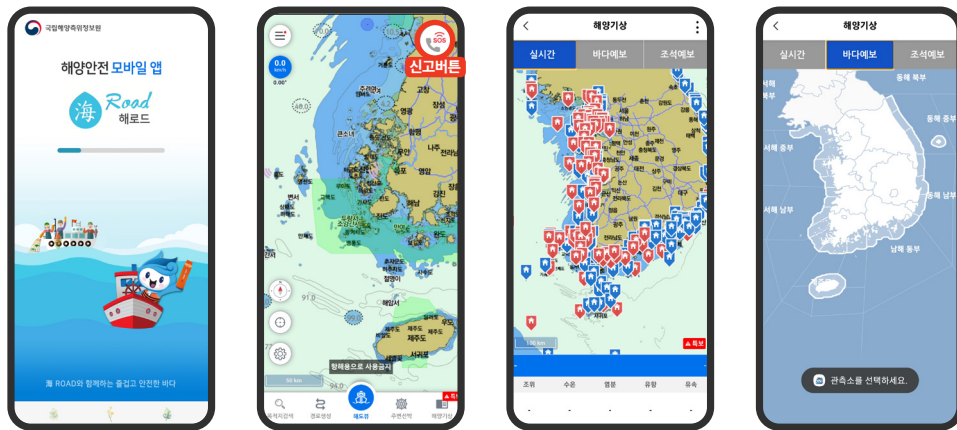
< 해양안전 모바일 앱 '해로드' >

- 신고시 요구조자의 위치가 상황실에 좌표로 전달되는 해로드 앱(해수부)을 설치해두도록 합니다.