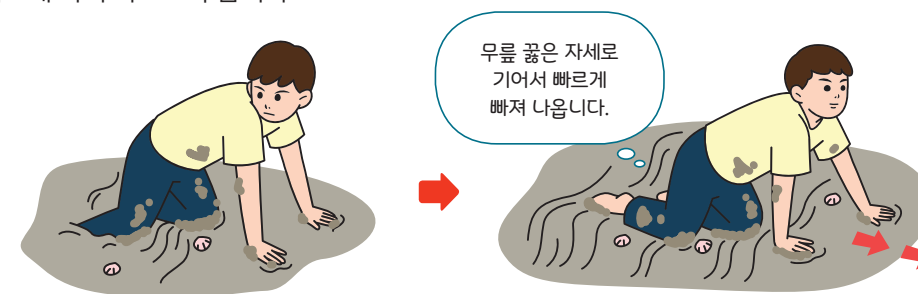
< 갯벌에 발이 무릎 이하로 빠진 경우 탈출요령 >