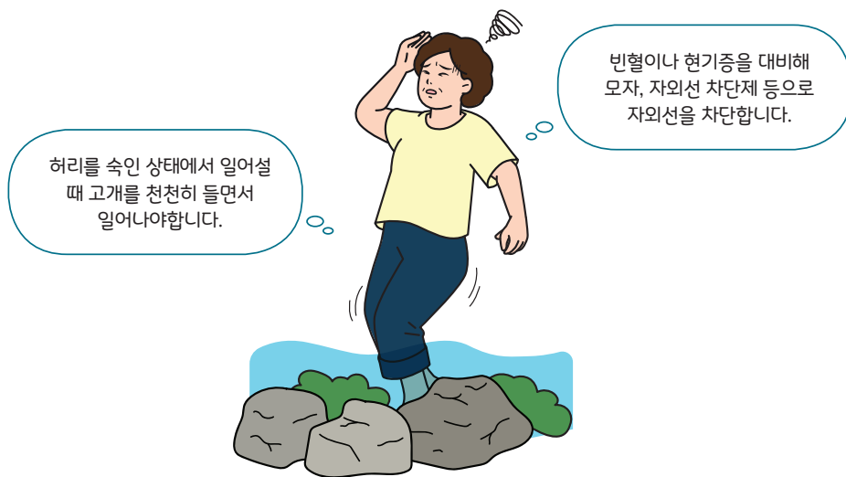
< 빈혈, 현기증 유의사항 >