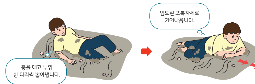
< 갯벌에 발이 무릎 이상으로 깊이 빠진 경우 탈출요령 >