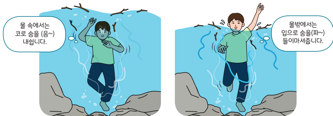
< 음파호흡법 >

① 계곡은 불규칙한 바닥지형으로 웅덩이가 많고, 바위·나무들로 그늘이 생겨 육안으로 수심을 가늠하기 어려우며, 폭포 및 바위 등으로 유속이 불규칙하여 안전사고 위험이 높으므로 가급적 물에 들어가지 않아야 합니다.