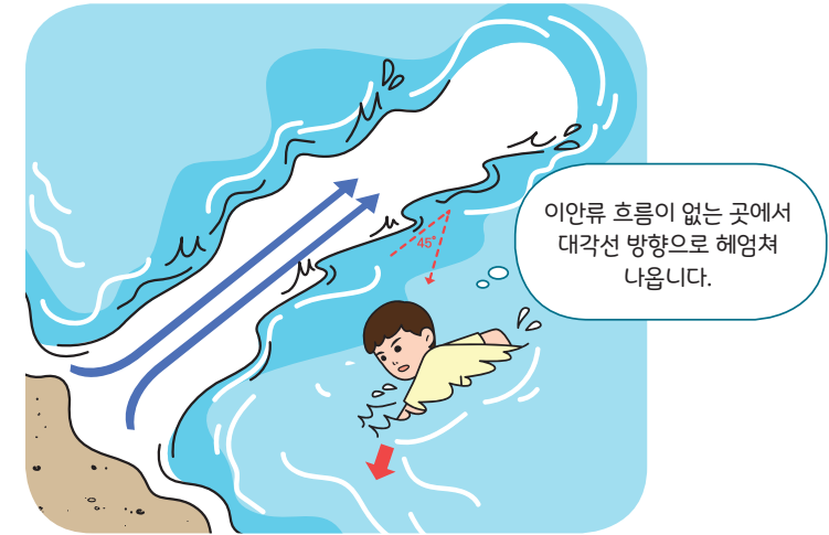
< 이안류를 벗어나 45도 방향으로 헤엄쳐 나오는 과정 >