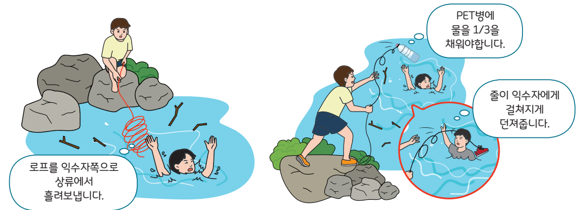
< 긴 로프를 활용한 구조법 >