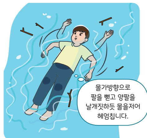
< 스컬링 동작 >