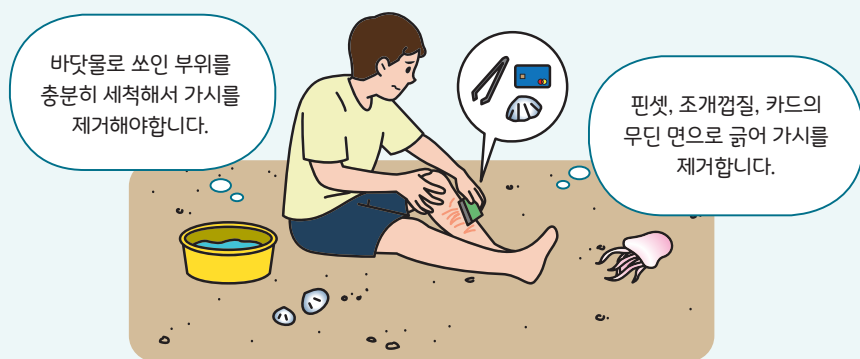
< 해파리에 쏘인 경우 대처요령 >