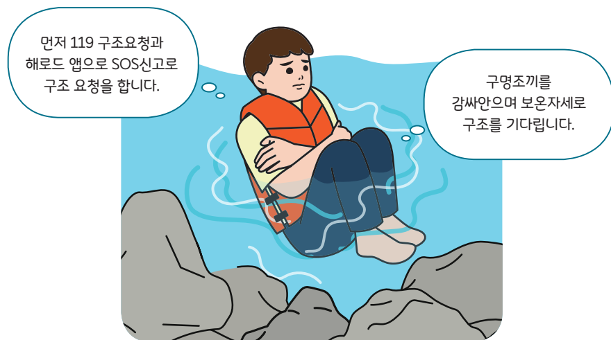
< 구조 전까지 체온유지(보온) 자세 >