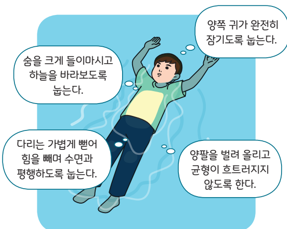
< 누워뜨기 자세 >