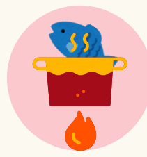
음식 익혀먹기 (특히 조개, 어패류 등)