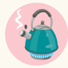
물 끓여 마시기