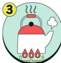
물은 끓여 마시기