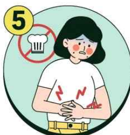
설사 증상이 있는 경우 음식 조리 및 준비 금지