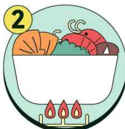
음식은 충분히 익혀 먹기