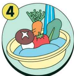
채소, 과일은 깨끗한 물에 충분히 씻어 먹기