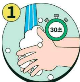
올바른 손씻기 생활화