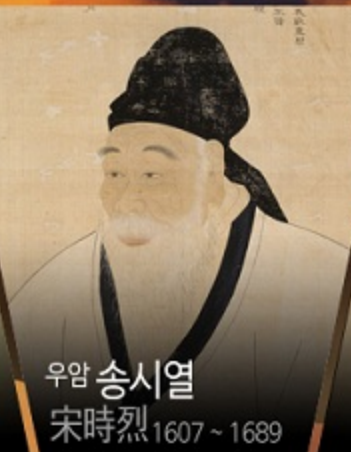
우암 송시열 宋時烈 1607 ~ 1689