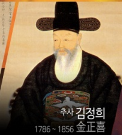
추사 김정희 金正喜 1786 ~ 1856