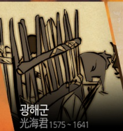
광해군 光海君 1575 ~ 1641