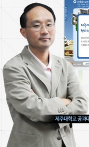
제주대학교 공과대학 건축학부 건축학전공

「길」과「건축」, 이미 변화된 사회활동의 조건 속에서 아름다운 도시와 주거문화, 그리고 생명력있는 도시와 건축문화를 만들어 가는 방식에 대하여 논의해 봅시다.