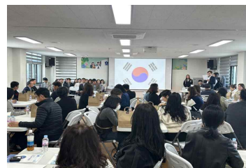
학교교육 설명회 (3/25)