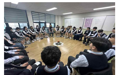
회복적 서클 (3/26~27)