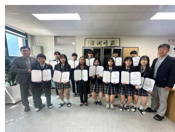
학생회 임명장 (4/7)