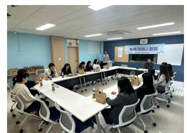
녹색어머니회 회의 (4/27)