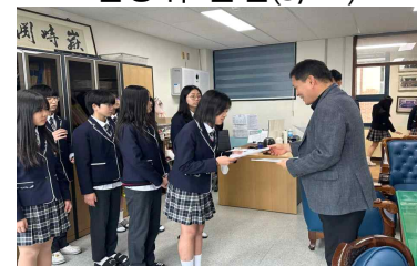
학생회 임명장 수여(3/13)