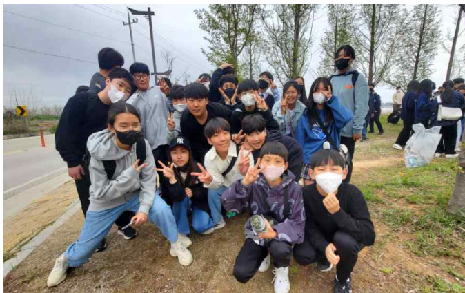
<고마제에 간 1학년 학생들>

4) 1-3학년 학생들은 즐거운 봄철현장 체험학습을 다녀왔습니다. (2023.04.14.)