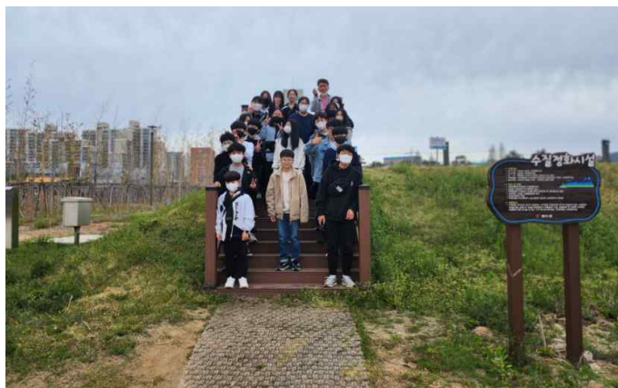
<썬키스트로드에 간 2학년 학생들>