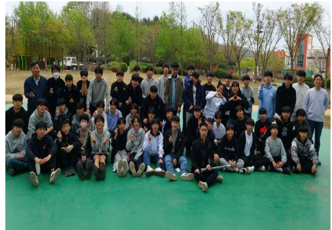
<매창 공원에 간 3학년 학생들>