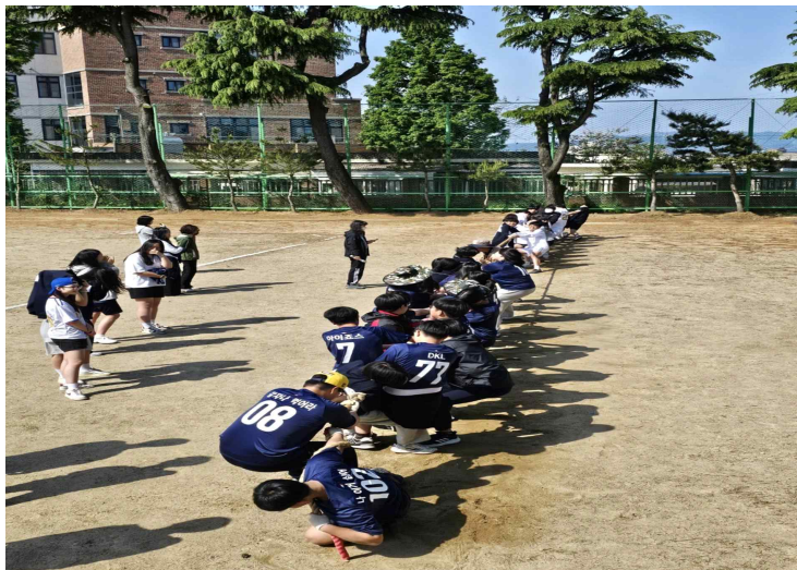
5) 봄철 체육행사(5. 10.)