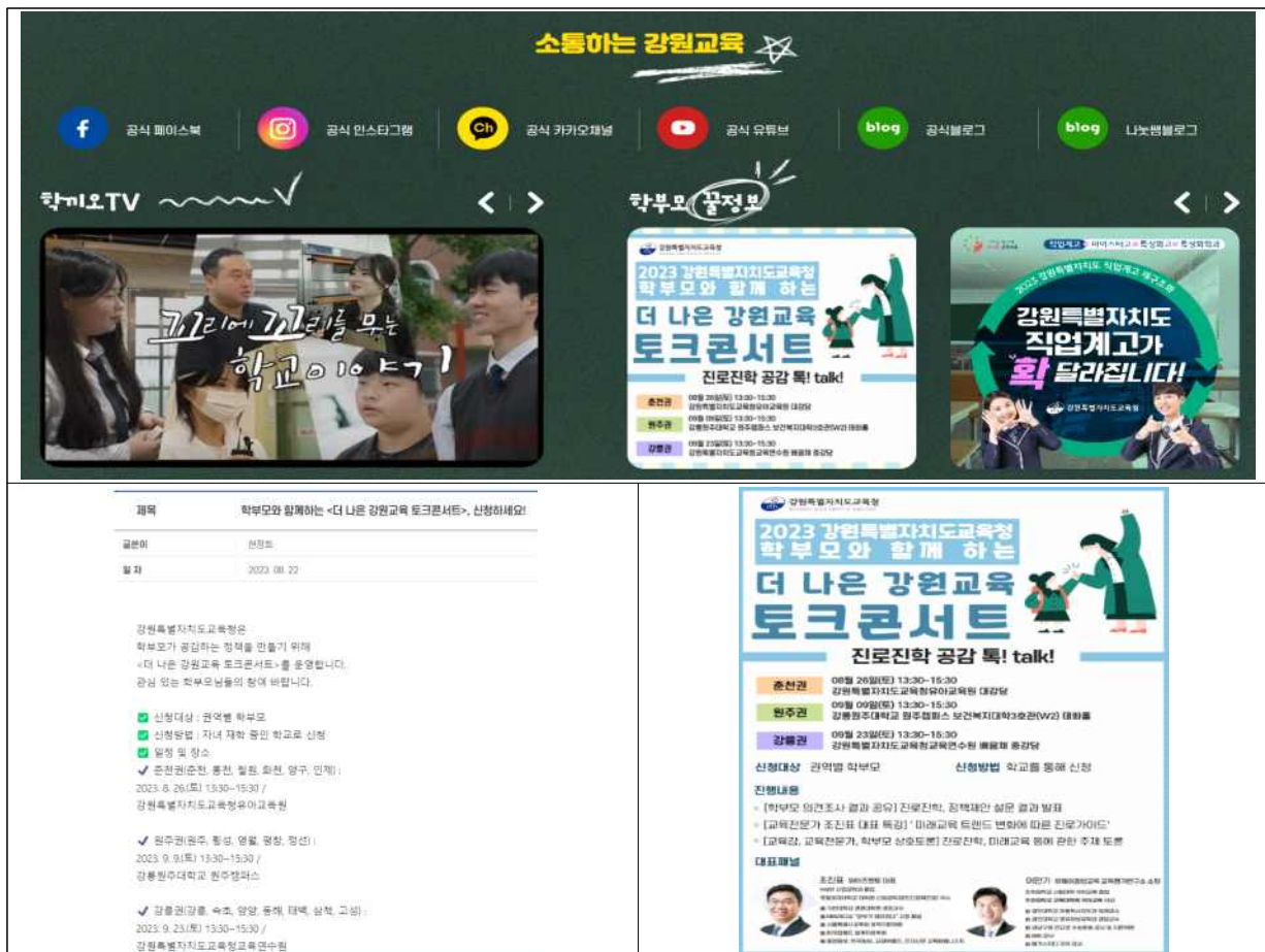
<도교육청 홈페이지를 이용한 홍보 예시>