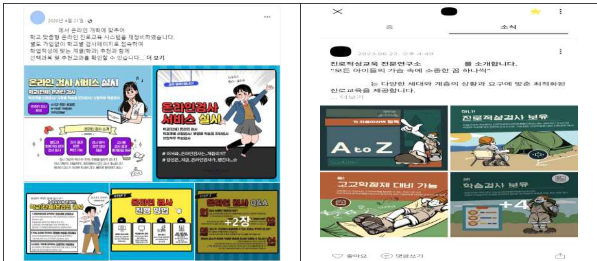
<SNS 홍보 예시>