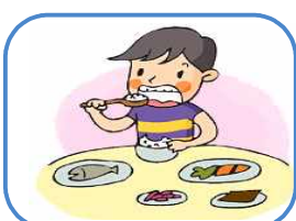
균형 잡힌 영양섭취