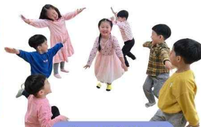
애벌레의 변신 신체표현