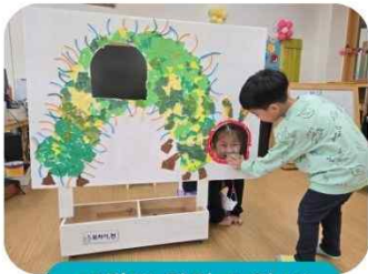
애벌레 맛있게 먹어!