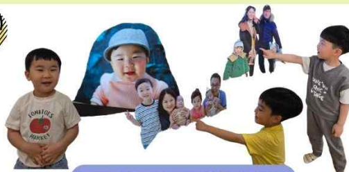
누구일까요? & 우리 가족 소개하기