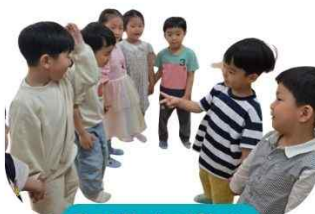
우리 집에 왜왔니~