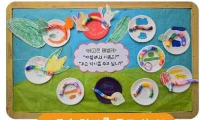
무슨 먹이를 주고 싶니?

놀이터 나무 아래 꿈틀거리는 애벌레를 관찰하며 호기심 가득한 얼굴로 “애벌레는 뭐 먹고살아요?”, “나중에 나비 되는 거예요?” 하며 궁금해 했어요. 애벌레가 사는 곳, 먹이 등 궁금한 것들에 대해 이야기 나누어 보고 친구들과 ‘배고픈 애벌레’ 그림책도 함께 보았어요. 코인티슈 애벌레 만들기를 하며 애벌레 길이만큼 코인티슈를 찢아보며 숫자도 세어보고 친구의 애벌레 길이와 비교해 보았어요. 알록달록 예쁜 색으로 꾸민 애벌레 코인티슈에 물을 흡수시켜 주~~욱 길어지며 변화하는 모습도 관찰해보고, 애벌레 이름도 지어주었어요. 애벌레에게 주고 싶은 먹이도 만들어 먹이 주는 놀이도 해보고 앞에서 부터 나비가 되기까지 변화 과정을 신체로 표현해보며 자연스럽게 나비의 변신 과정을 경험해보는 시간을 가졌습니다.