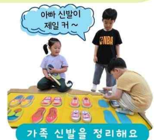
가족 신발을 정리해요