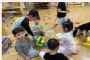
이순신 거북선vs 일본 놀이