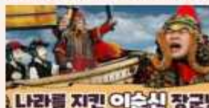
나라를 지킨 이순신 장군