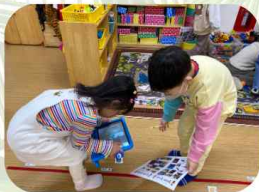
AR로 공룡 찾기

그렇게 시작한 'AR로 공룡 찾기' 그 이후에도 공룡으로 놀이를 이어가고 있어요!