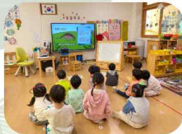
공룡 퀴즈 맞추기

스마트TV로 유아가 고른 공룡 그림을 어플리케이션을 통해 숨겨요. 짝꿍과 함께 찾다가 어려우면 TV에 나온 힌트를 보며 다시 찾아요. 여러번해보니 규칙과 안전약속을 잘 지키며 게임하는 아이들이랍니다.