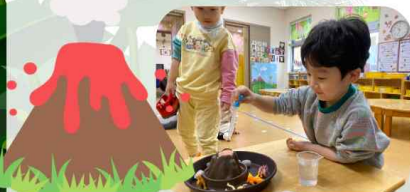
화산 폭발 실험