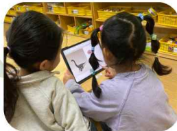
AR로 공룡 찾기