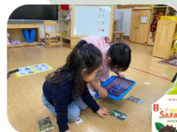
공룡 AR 카드