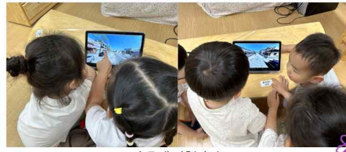
우리 동네 산책하기

유치원 주변에 있는 한옥마을을 테블릿으로 산책하면서 직접 가봤던 경험을 친구들과 나누었고, 우리집 주변에는 어떠한 건물들이 있는지 함께 살펴보았어요!