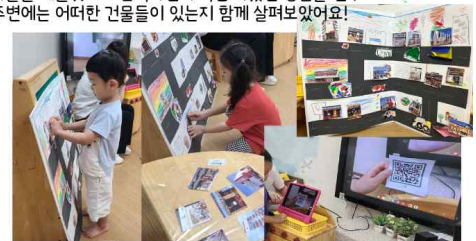
우리동네 지도만들기 2

도로가 만들어진 종이를 제공하여 아이들이 테블릿으로 산책하며 본 우리의 주변 모습을 그려보았어요. 나무, 꽃, 횡단보도, 신호등, 버스정류장, 아파트, 자동차 등을 그리는 모습을 보였습니다.