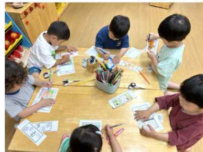
우리 동네 가게 만들기