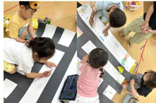
우리동네 지도만들기 1

우리가 알아본 우리동네의 기관과 가게들이 QR코드로 담겨 있는 캡슐을 찾은 다음 내가 찾은 곳에 관련된 물건을 찾아 오는 놀이를 해보았어요~