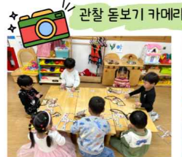
관찰 돋보기 카메라

모음 만들기 후 다같이 즐겁게 과자를 먹어요. 궁금했던 과자의 맛도 느껴보고, 한글 놀이도 하고 일석이조예요!