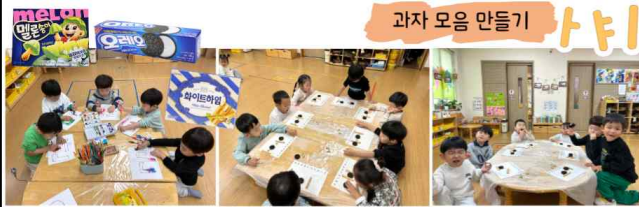
과자 모음 만들기

과자봉지 놀이를 하면서 맛이 궁금했던 과자로 모음 만들기를 해보기로 했어요! '한글 모음 파티' 글자를 꾸며 놀이 준비를 해보아요.