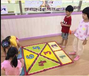
‘ 사방치기 ’

아이들에게 사방치기 놀이를 소개하고, 안전 을 위해 콩주머니를 사용하여 사방치기 놀이를 했어요. 어떻게 하는 놀이인지 먼저 알려주기보다 놀이 방법을 스스로 창안 해 아이들이 만든 방법 으로 놀이했어요. 자신의 콩주머니를 던지고 그곳에 가서 앉는 방법! 그 다음 날, 원래 놀이 방법을 알려주었어요.