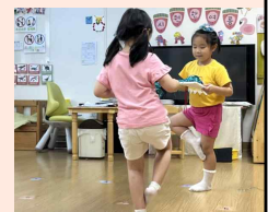
‘ 제기차기 ’

제기와 네모판을 끈으로 연결해 제기를 튀겨보는 방법으로 제기 놀이를 소개했어요. 발로 해보고 싶은 친구는 끈을 풀어 놀이하고, 사진과 같이 한 발 서기를 하고 제기를 튀겨보는 등 놀이 방법을 스스로 만들어내는 아이들 입니다♥