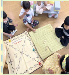
‘ 윗놀이 ’

아이들에게 사방치기 놀이를 소개하고, 안전 을 위해 콩주머니를 사용하여 사방치기 놀이를 했어요. 어떻게 하는 놀이인지 먼저 알려주기보다 놀이 방법을 스스로 창안 해 아이들이 만든 방법 으로 놀이했어요. 자신의 콩주머니를 던지고 그곳에 가서 앉는 방법! 그 다음 날, 원래 놀이 방법을 알려주었어요.