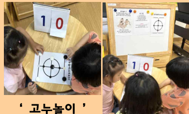
‘ 고누놀이 ’

상대방의 바둑돌이 더 이상 움직일 수 없게 막으면 이기는 놀이로, 머릿속으로 경우의 수를 생각하고 수를 예측하며 신중하게 움직여야 하는 놀이입니다. 두뇌 발달UP!