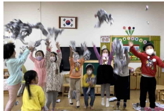
신문지 놀이 3탄 ‘신문지의 변신’

신문지를 힘껏 구겨 공을 만들었어요! 큰 바구니에도 골인! 작은 통에도 골인!