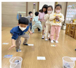
신문지 놀이 2탄 ‘공이 된 신문지’

신문지를 단계별로 접어 그 위에 올라가는 신체활동을 했어요. 처음엔 혼자, 두 번째는 친구랑 짝을 지어 해보았어요^^