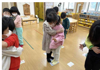
신문지 놀이 1탄 ‘신문지가 점점 작아져요’

신문지를 단계별로 접어 그 위에 올라가는 신체활동을 했어요. 처음엔 혼자, 두 번째는 친구랑 짝을 지어 해보았어요^^