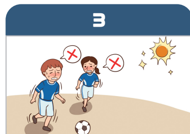
더운 시간대에 휴식을 취한다. (운동장 등 실외활동을 자제한다.)