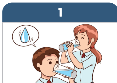
물을 자주 적당히 마신다.