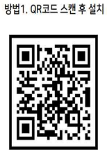
방법1. QR코드 스캔 후 설치