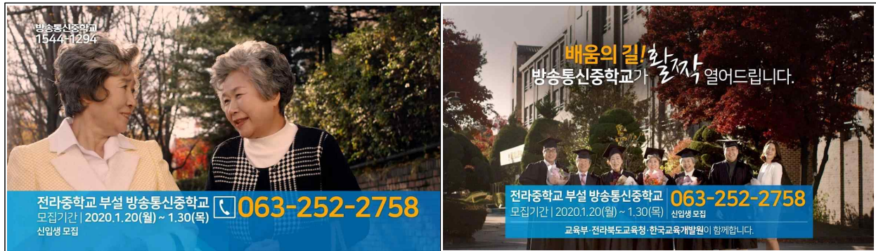
[방송통신중학교 학교별 영상]