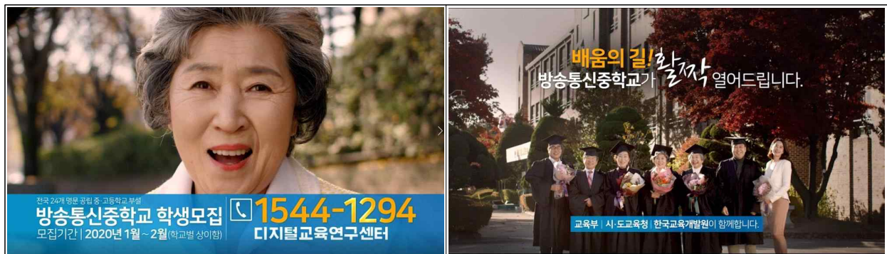
[방송통신중학교 통합 영상]