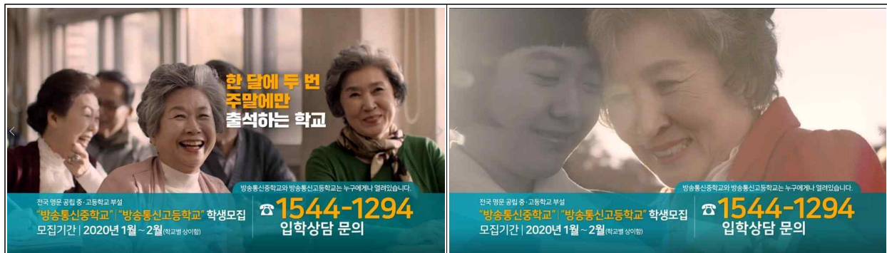
[방송통신중·고등학교 통합 영상]