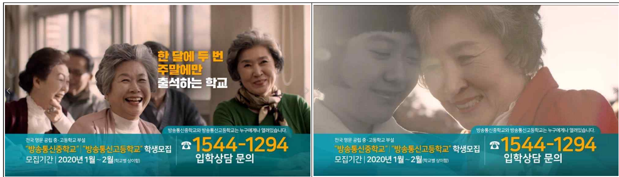
[방송통신중·고등학교 통합 영상]