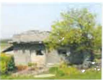
⑫ 화호중앙병원 영안실