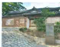
③ 정음 화호리구 일본인농장 가옥 (국가등록문화재)