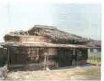
⑩ 정음 화호리구 일본인농장 가옥 (전라북도 등록문화재)