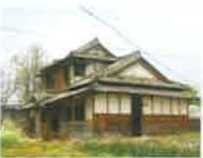
⑪ 화호 우체국(철거)