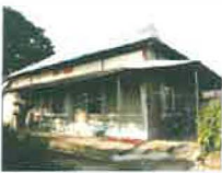
⑨ 일본인 직원 사택