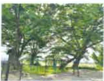
④ 화호리 마을회