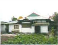
⑧ 일본인 직원 사택