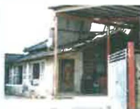
② 경리과장 사택