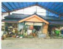
⑤ 직원 합숙소