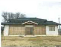
⑥ 농산과장 사택