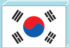
대한민국 [ 군산시 ]