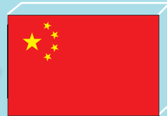
중국 [ 옌타이시 ]