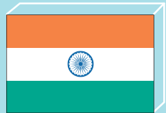
인도 [ 펴프리 친차드시 / 잠세드 푸르시 ]