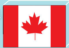
캐나다 [ 윈저시 ]