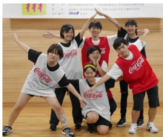
주 재회 학생 울산 공업 고등학교 2 학년