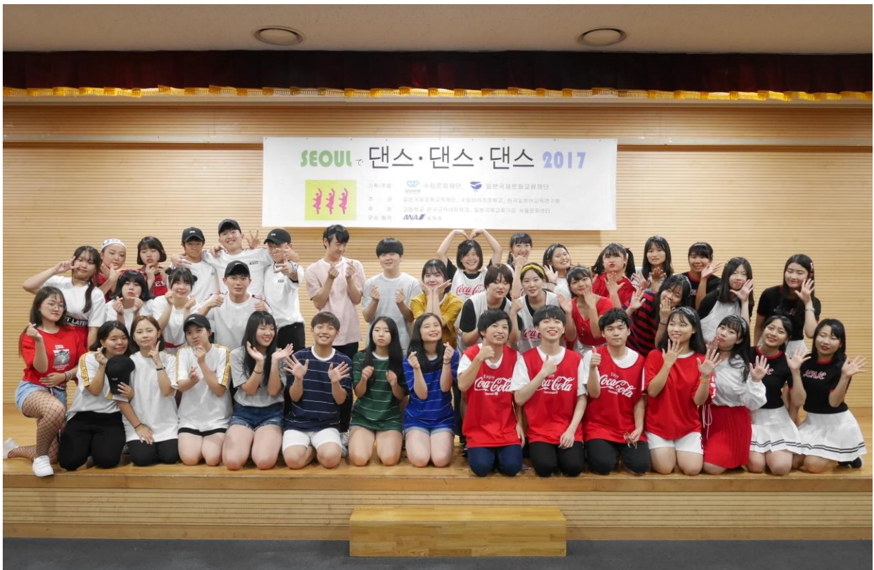
<2017 년 8 월 10 일 발표회 시 찍은 집합 사진>