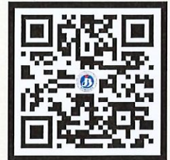
프로그램 다운로드 바로가기 QR코드