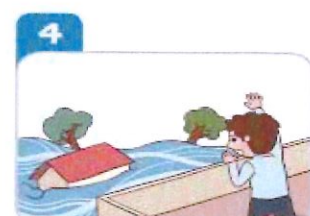
4 안전한 곳으로 대피하여 구조를 요청한다.