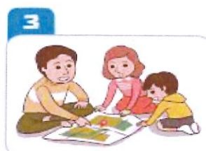
3 가족 간의 비상 시 연락방법과 대피장소를 미리 지정한다.