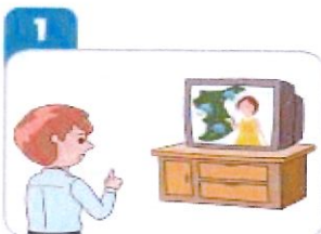
1 방송 매체를 통해 기상상황을 확인한다.