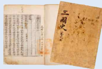
↑ 《삼국사기》(경주 옥산 서원) 고려 인종 때 김부식 등이 왕명을 받아 편찬한 기전체 역사서로, 현재까지 전하는 우리나라의 역사서 중에 가장 오래되었다.

한편 무신 정변 이후의 사회 혼란과 몽골의 침입을 겪으면서 고려의 독자성을 바탕으로 전통문화를 이해하려는 경향이 나타났다. 이규보의 <동명왕편>, 일연의 《삼국유사》, 이승휴의 《제왕운기》 등이 대표적이다.