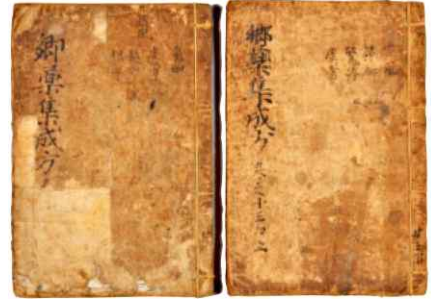
↑ 《향약집성방》(국립중앙박물관) 향약은 우리나라에서 생산되는 약재를 의미한다. 이 책은 우리나라에서 시행되는 처방법 등을 수집해 편찬한 책이다.