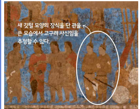
↑ 아프라시아브 궁전 벽화(우즈베키스탄 사마르칸트) 비단길의 중심 도시였던 사마르칸트에는 7세기에 그린 것으로 추정되는 벽화가 있다. 이 벽화에는 고구려 사신으로 추정되는 인물이 그려져 있다.

원효는 종파 간의 대립을 해소하는 이론을 독창적으로 발전시켰으며, 의상은 당에서 유학하고 귀국한 후 교종의 하나인 화엄종을 크게 유행시켰다.