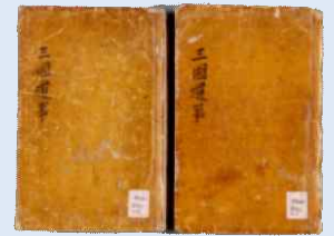
↑ 《삼국유사》(서울대 규장각한국학연구원) 일연이 불교사를 중심으로 고대의 민간 설화 등을 기록한 역사서로, 우리 역사의 시작을 단군 조선으로 설정했다.