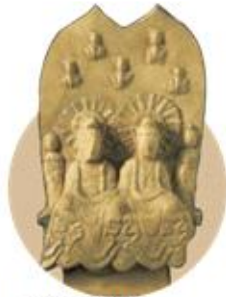
↑ 이불병좌상 (중국 지린성 혼춘 출토)