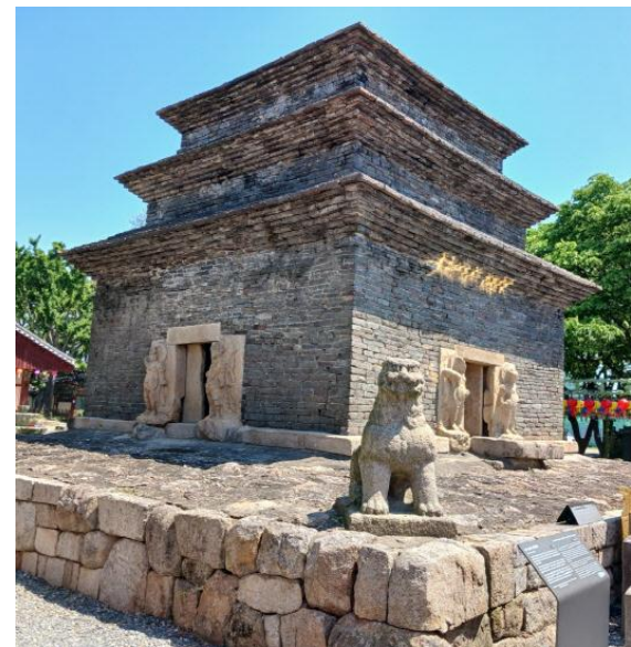
경주 분황사 모전석탑(신라)