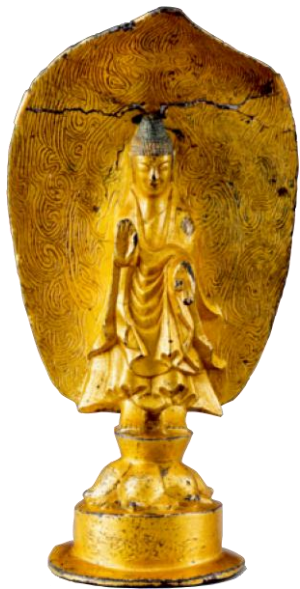
금동 연가 7년명 여래 입상(고구려)