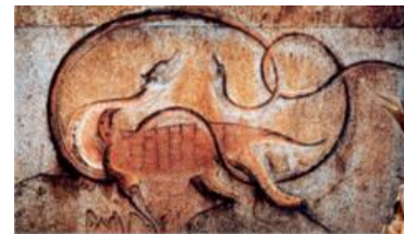
↑ 강서 고분의 사신도 중 현무도 (명남 강서) 도교의 방위신인 사 신은 청룡(동), 백호(서), 주작 (남), 현무(북)를 가리킨다.