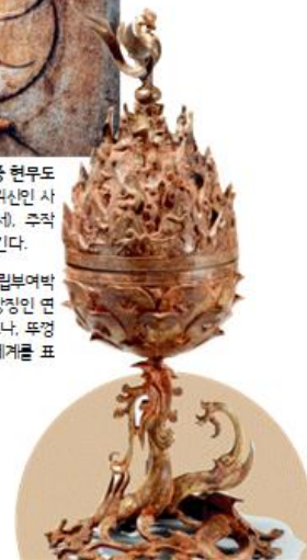
→ 백제 금동 대향로(국립부여박 물관) 몸체는 불교의 상징인 연 꽃으로 장식되어 있으나, 뚜껑 부분은 도교의 이상 세계를 표 현하고 있다.