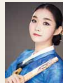
소리 양 미 래