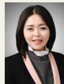
해금 이 정 아