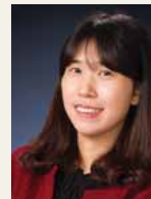
트럼본 유 가 은