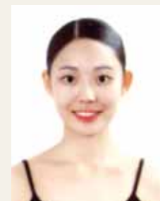
한국무용 신 설 화