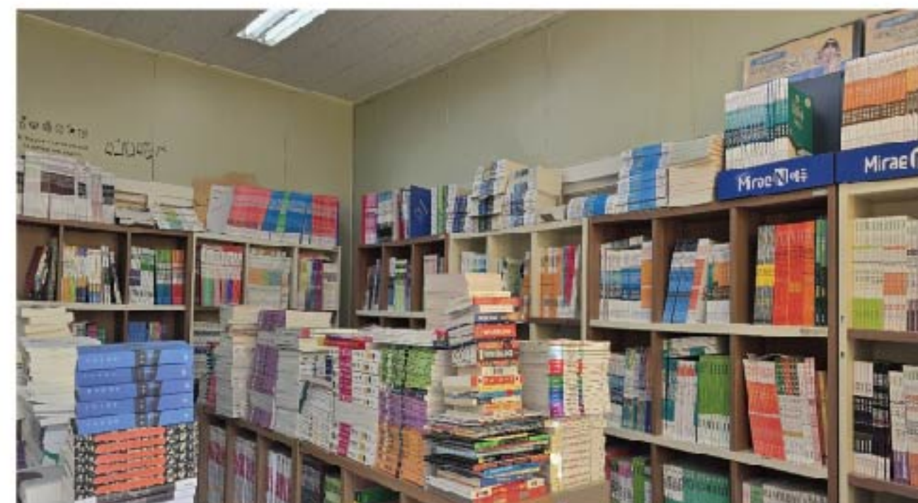
남원현서점 역재1길 6-1 월-금 9:00~20:00, 토 9:00~18:00 063-626-9903