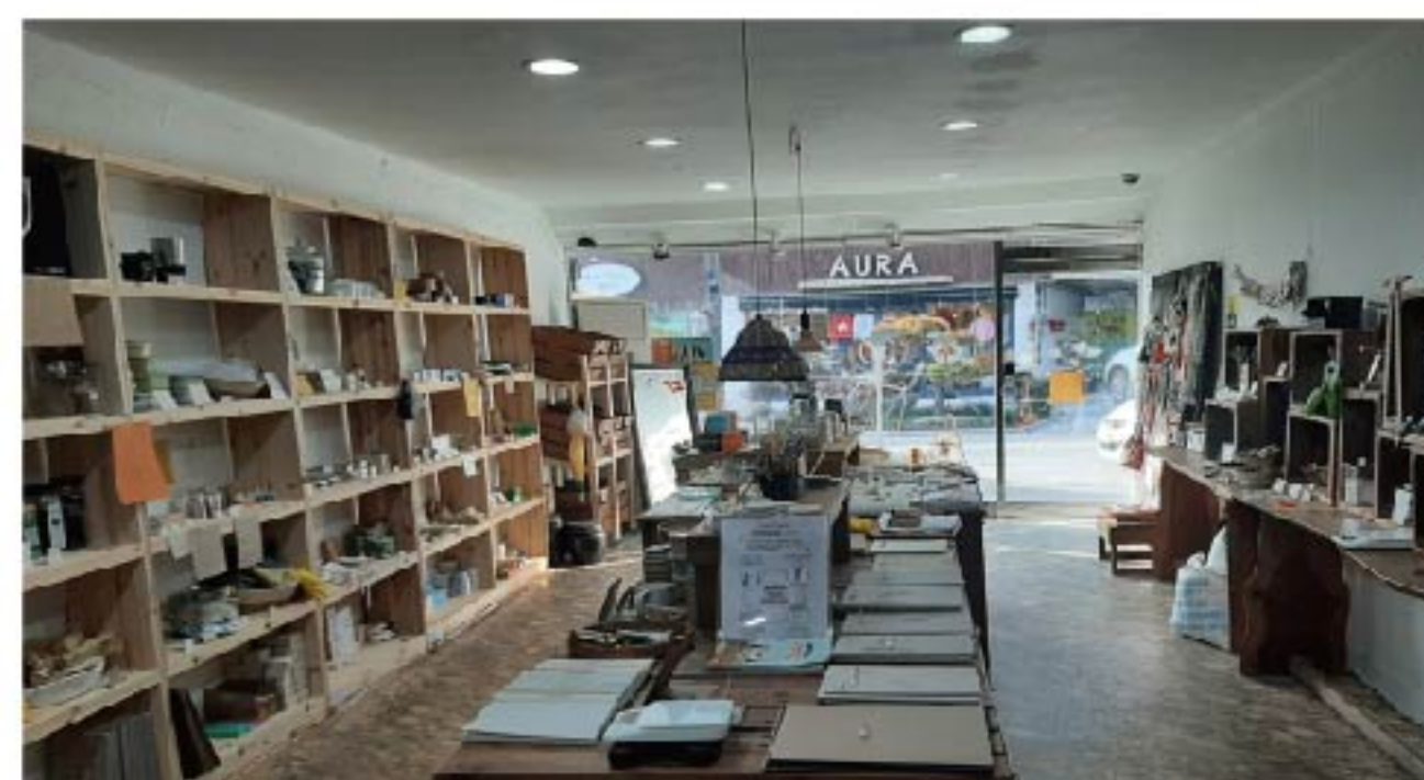
비니루없는 점빵 광한북로 34-3 화-토 12:30~18:30 063-626-0703