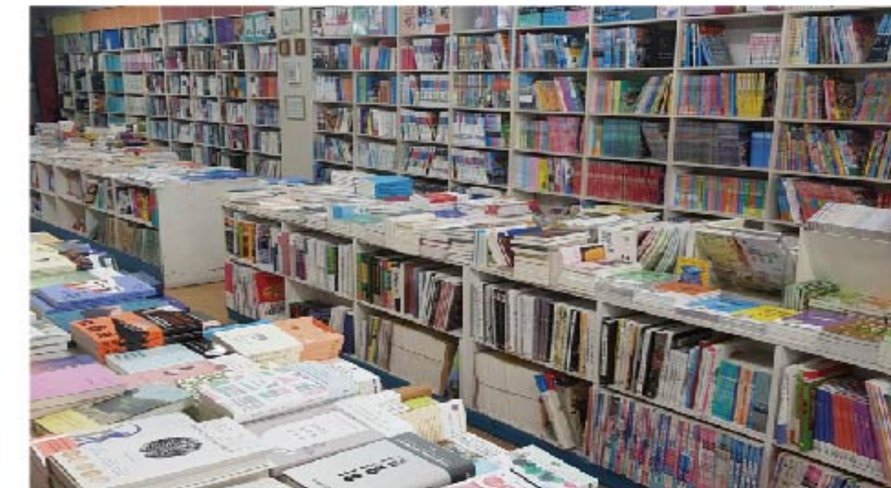
진서점 광한북로 45-1 월-토 10:00~20:00 063-625-4988