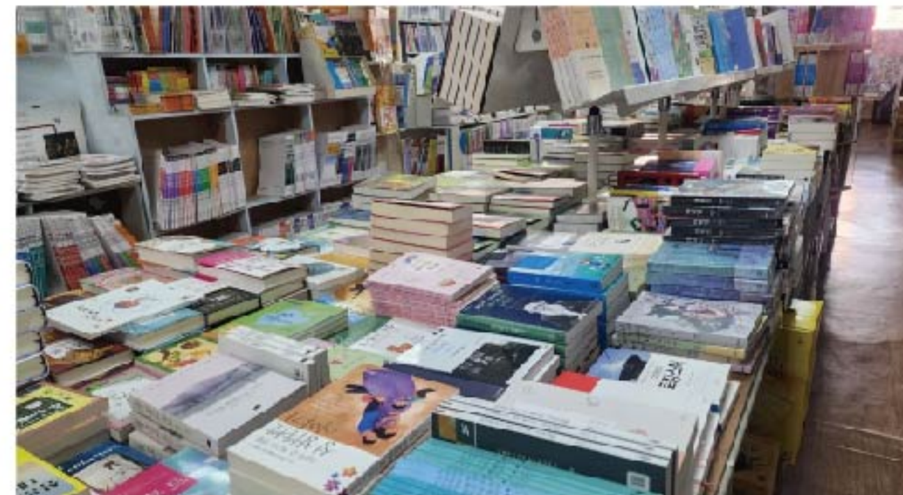
신성지서림 충정로 116 월-토 9:00~20:00 063-632-3834