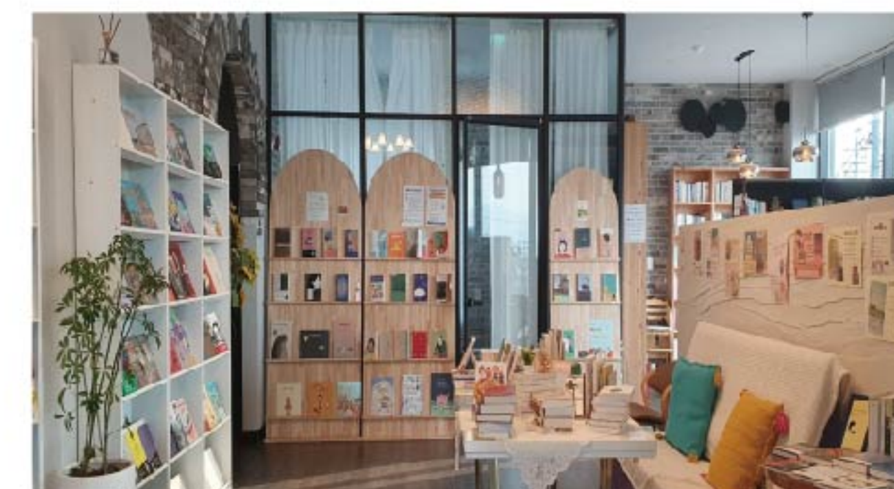
비본책방 쑤고개로 25(2층) 월-토 11:00~19:00 0507-1456-7847