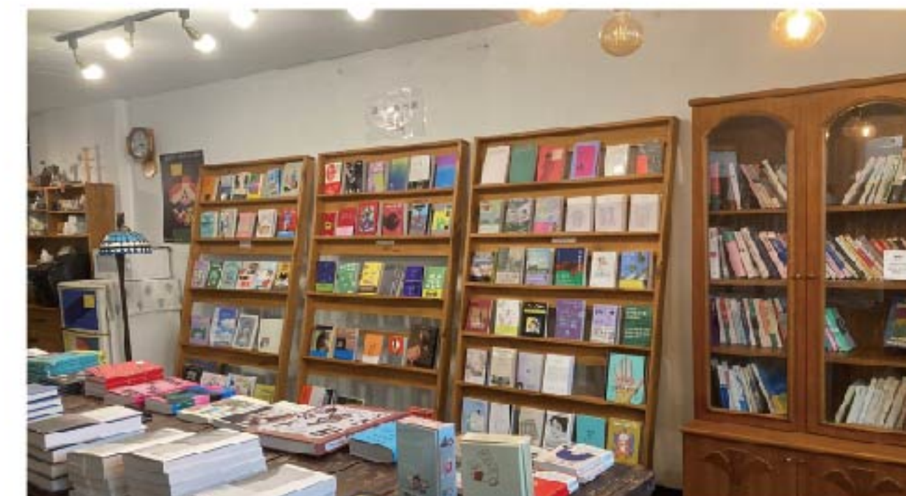
살롱드마고 시청북로 17(2층) 목-토 11:00~17:00 070-7797-3800