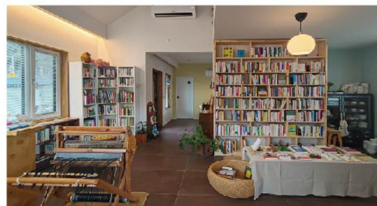
찬장과 책장 산내면 대정방천길 1-4 수-토 12:00~17:00 0507-1415-0394