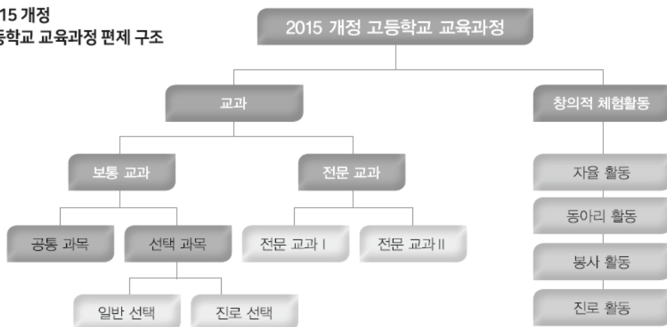
2015 개정 고등학교 교육과정 편제 구조