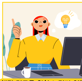
해당 직무를 위한 노력과 역량