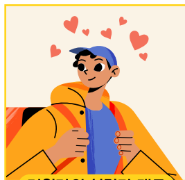
지원자의 성격과 태도