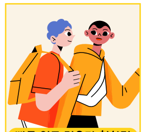
빠른 업무 적응과 친화력

인사 담당자들이 가장 중요하게 강조하는 것은 지원자들의 성격과 태도 입니다. 차분한 성격이더라도 능동적이고 적극적인 경험 을 가진 지원자를 선호한다고 합니다. 직무 지식은 단순한 스킬이 아니라 이 업무를 잘하기 위해 어떤 노력을 했는지가 중요하며, 노력의 결과가 아닌 잠재력 을 보는 것입니다. 빠른 업무 적응을 위해 선배들과 잘 지낼 수 있는 친화력 도 중요 요소라고 하니 참고해 보세요!