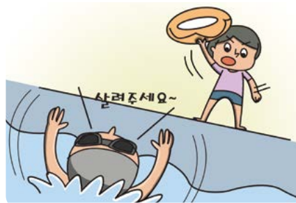
물건을 이용하여 구조하기