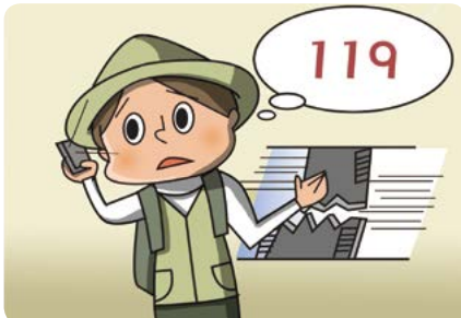
119에 도움 요청하기