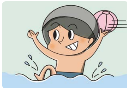
수영 실력 뽐내지 않기