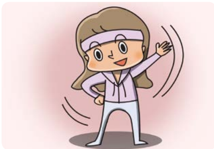
충분한 준비운동 하기