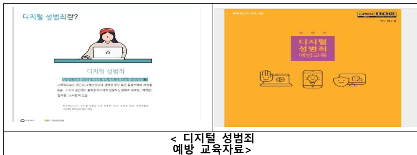
< 디지털 성범죄 예방 교육자료 >