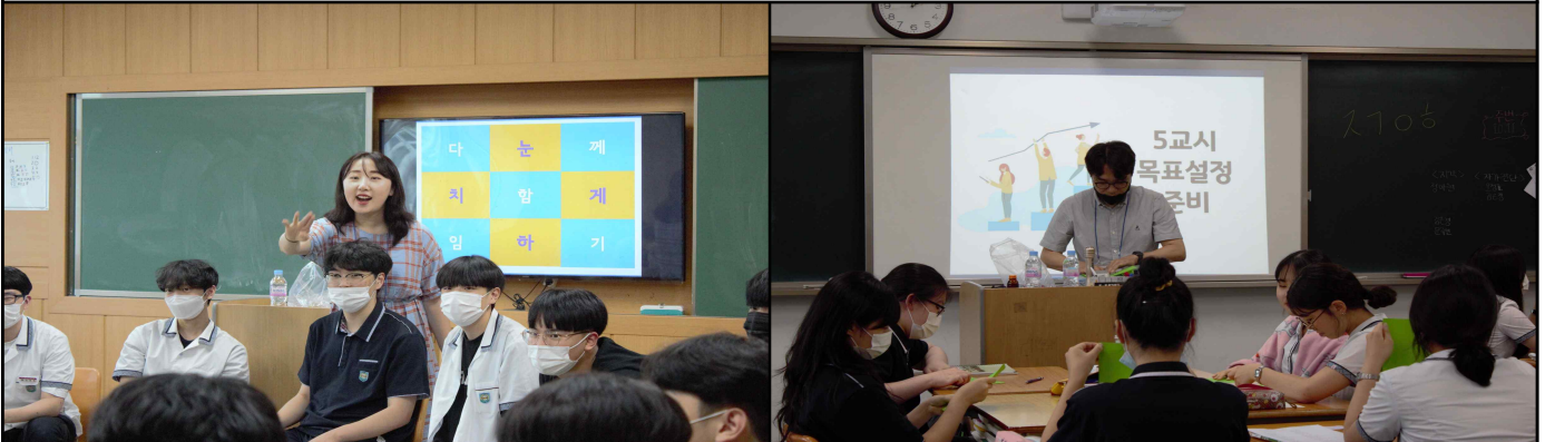
목표 설정 프로그램 만족도 조사 결과