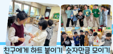
친구에게 하트 붙이기 숫자만큼 모이기