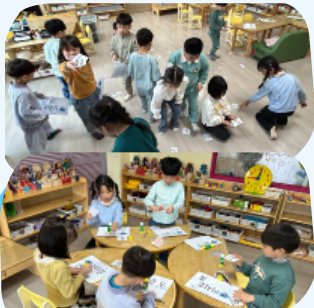
친구 이름글자 찾기