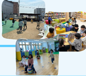
바깥놀이터, 강당, 도서관 등 유치원 다양한 공간 탐색하기