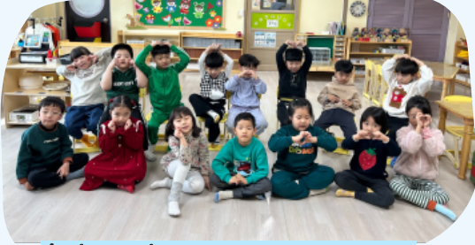
힘찬반 친구들에게 자기소개 하며 서로 관심가지기