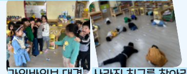
가위바위보 대결 사라진 친구를 찾아라 친구와 함께하는 게임하기