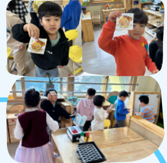
교실 속 보물찾기