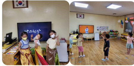
[한복과 태권도] -보자기로 한복을 만들고 한복 패션쇼를 보여 한복 패션쇼 놀이 -태권도 동영상 보여 태권도 따라하기