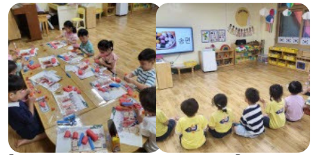
[한옥 만들기과 전통음식 퀴즈놀이] 한옥에 대해 알아보고 여러가지 재료로 한옥 만들기&전통음식 부분만 보고 이름 맞추기