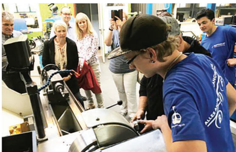
스위스 바르톨레 기계엔지니어링회사(Bartholet Swiss AG) 도제학생이 학부모 장관의 날 작업을 시연하는 모습